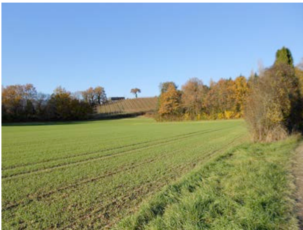
8) Réseau agro-environnemental de la Champagne genevoise au voisinage de Chancy