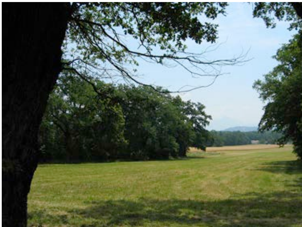
4) Forêts et clairières à Vandoeuvres