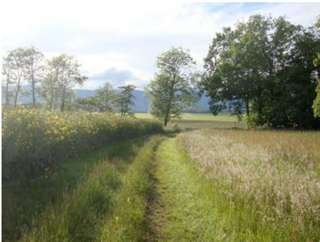
5) Réseau agro-environnemental de Céligny