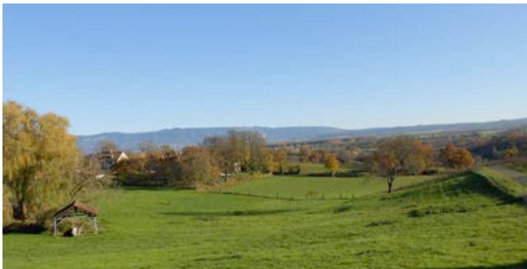
1) Réseau agro-environnemental de la Champagne genevoise entre Avusy et Chancy