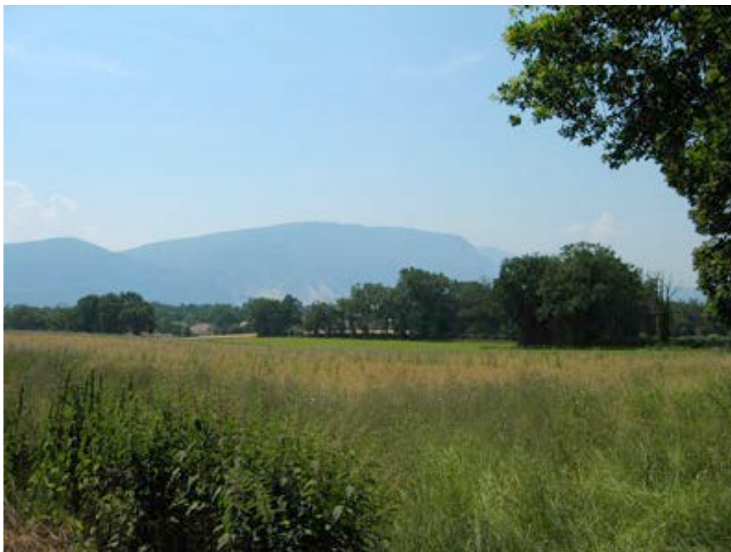
7) Prairies fleuries et bocage aux alentours de Cologny