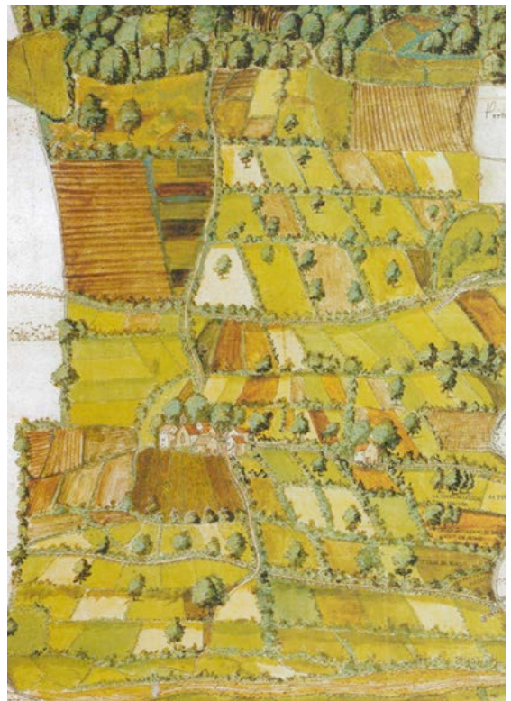
Carte de Céigny dessinée en couleur vers 1544. Un document exceptionnel pour la connaissance du paysage et de l'agriculture.

Au niveau cantonal, une fiche de coordination Paysage sera partie intégrante du nouveau plan directeur, mais il s'agira surtout d'intégrer avec finesse et cohérence les nouveaux outils fédéraux (paiements directs paysage) et demandes locales (p.ex. mesures d'accompagnement paysagères pour gérer les césures vertes et pénétrantes de verdure, ou les parcs d'agglomération). Les urbanisations envisagées à long terme empièteront par endroit sur l'espace rural, fragmenté par une mobilité régionale croissante. Le maintien des qualités de la campagne genevoise et de ses fonctions pour une population toujours plus demandeuse doit s'effectuer dans une réflexion globale qui tente de mieux intégrer l'agriculture en pleine mutation dans la société environnante et d'assurer une pérennité aux exploitants agricoles.