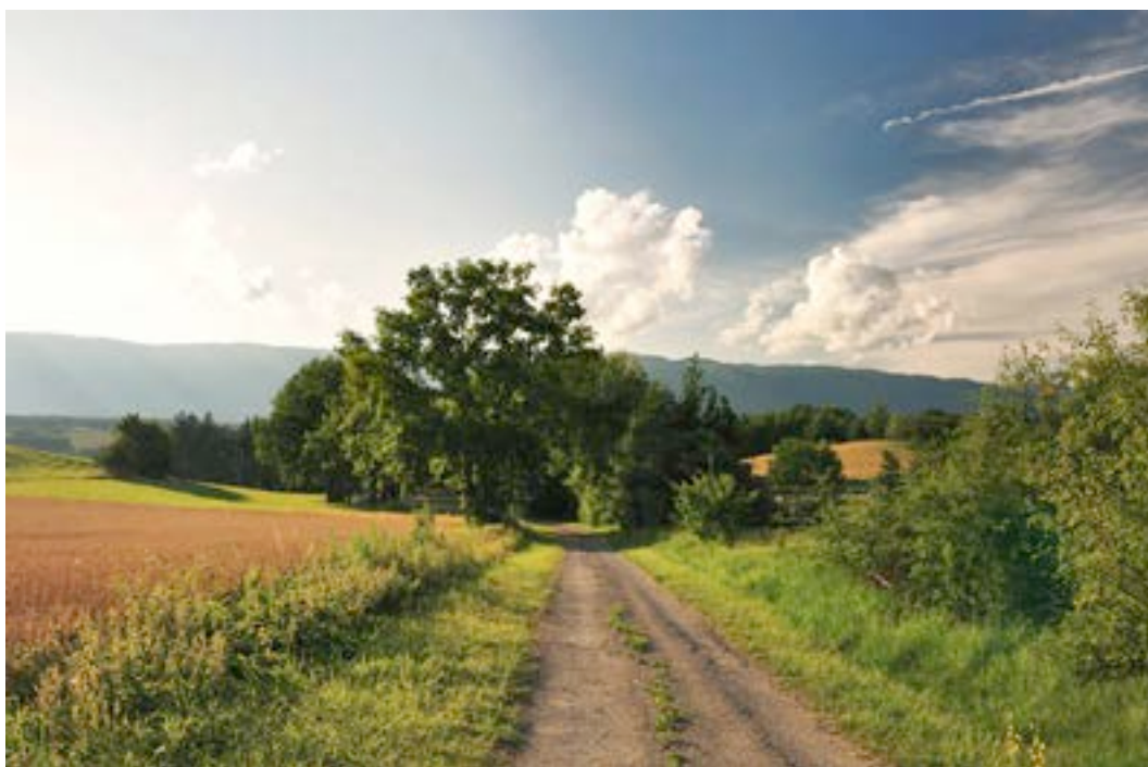
6) Réseau agro-environnemental de la Champagne genevoise près d'Avusy