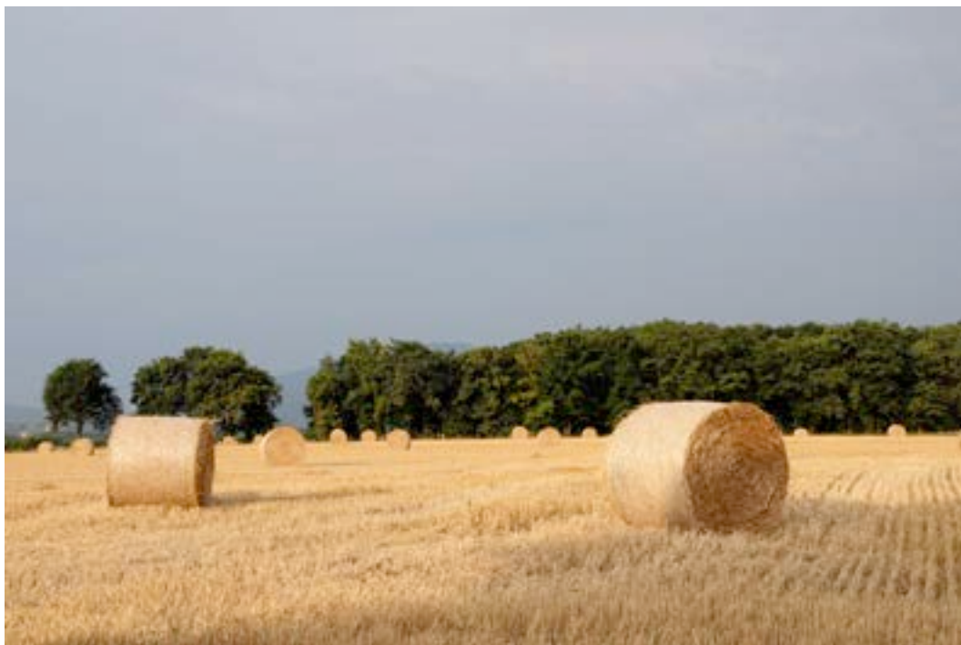
3) Grandes cultures et bocage de la campagne de Jussy