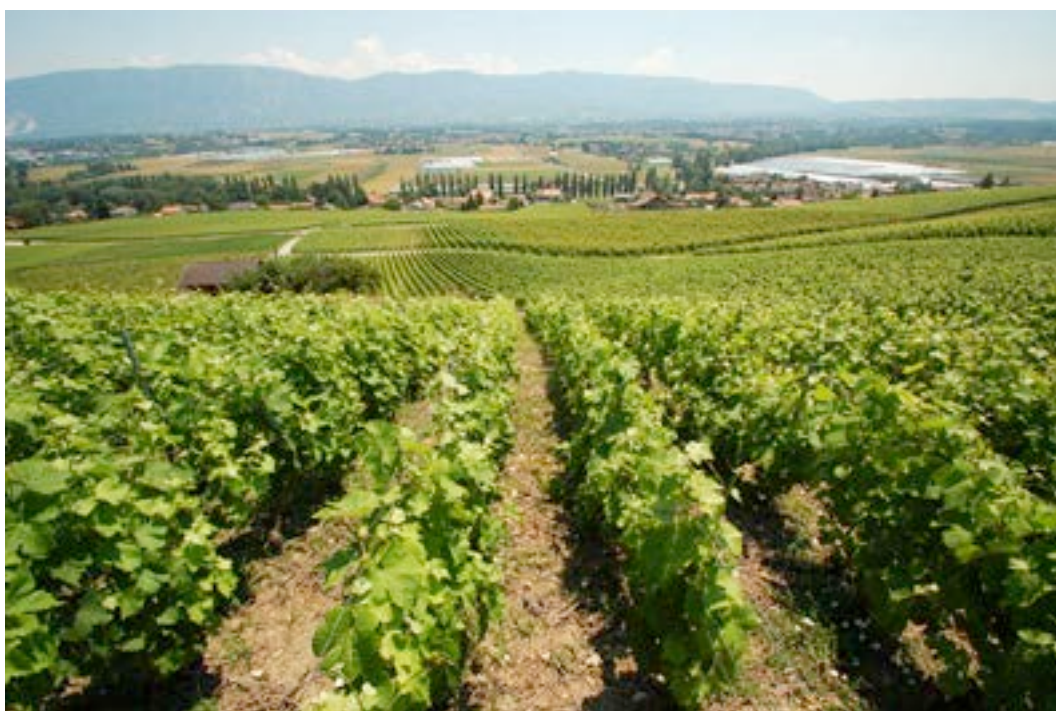
2) Réseau agro-environnemental de Bernex, vue sur la plaine de l'Aire