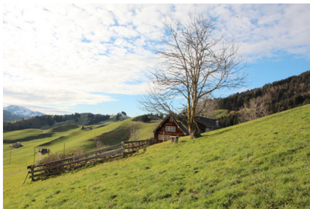
8) Rügger, Gonten AI 2014