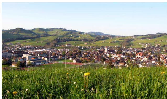
2) Freudenberg-Dorf AI 2008