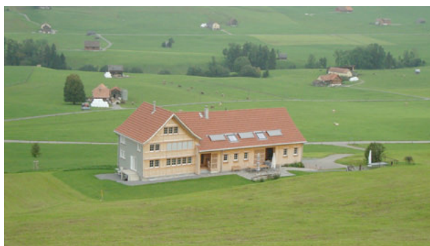
12) Brigler, Steinegg AI 2014