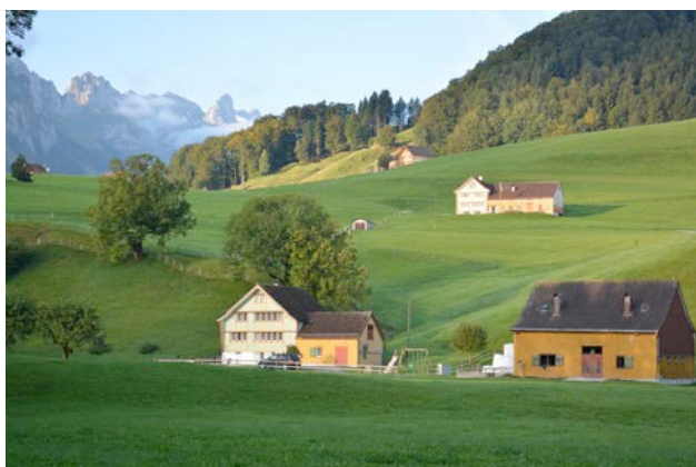
1) Nanisau-Alpstein AI 2013