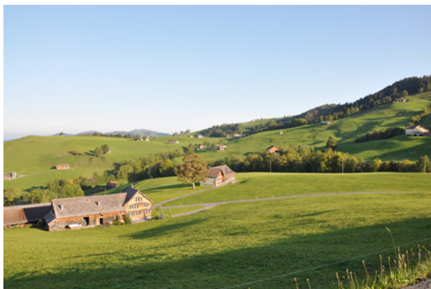
7) Schwarzenegg Bauernhaus AI 2011