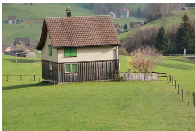
9) Untere Bitzi, Gonten AI 2014