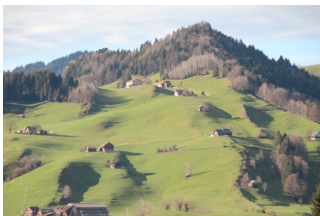
4) Rapisau-Höhi, Gonten AI 2014