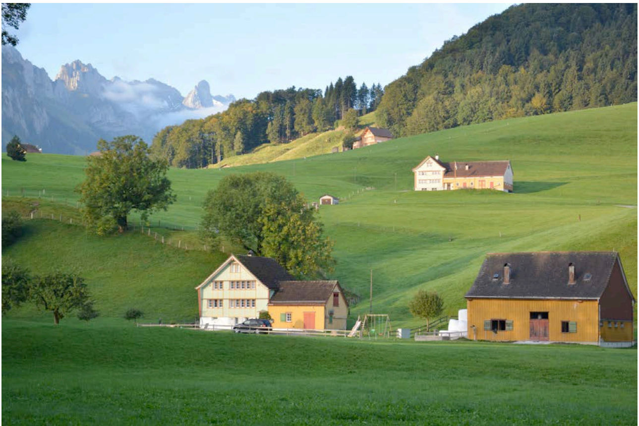
Nanisau-Alpstein 2013

Lauréat du prix: Canton d'Appenzell Rhodes-Intérieures