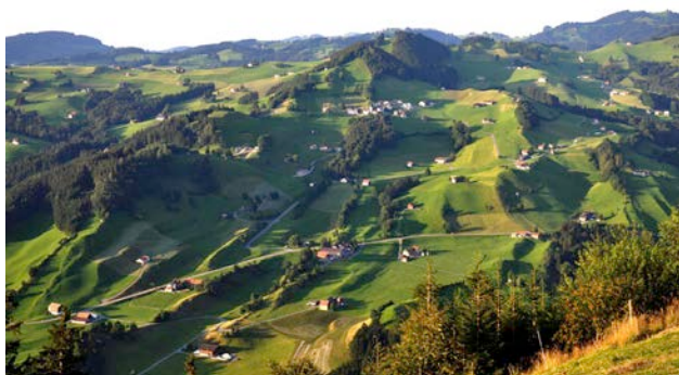
3) Schlatt-Leimensteig AI 2009