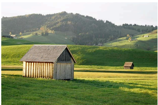
11) Les «Toobeschopfe» de Gontenmoos AI