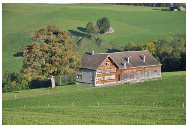
10) Schwarzenegg, Brülisau AI 2011