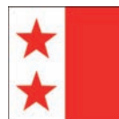
Ville de Sion