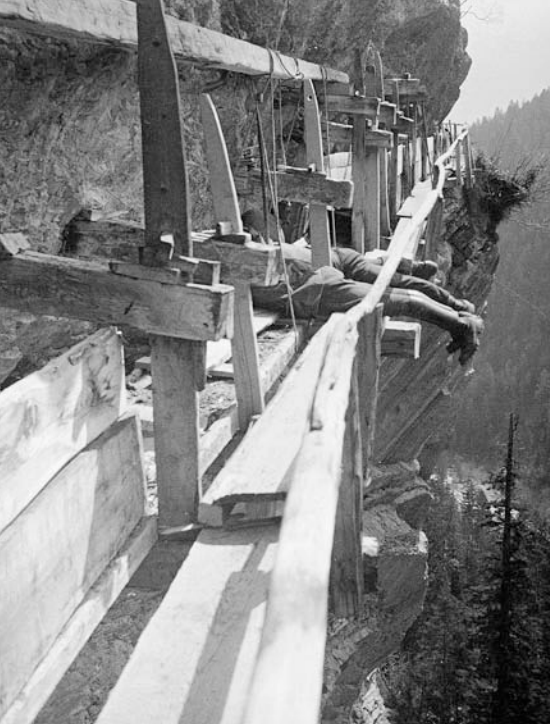
Bisse de Saviesse vers 1930 (Charles Paris, Médiathèque Valais - Martigny)