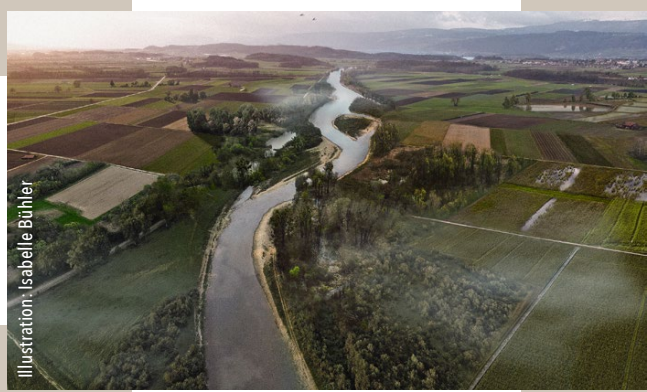
Illustration: Isabelle Bühler