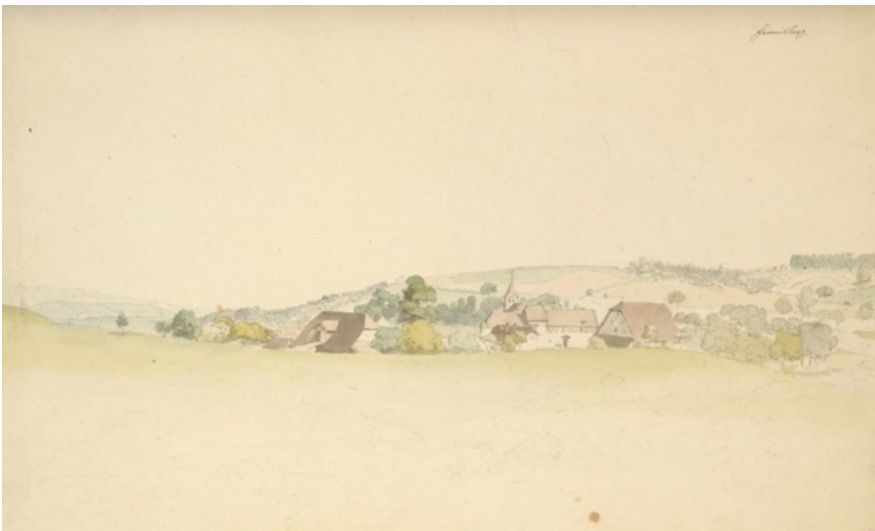
Abbildung 1: Frienisberg, Johann Ludwig Aberli nach 1760 (© Kunstmuseum Winterthur, Katalog online).

Die Weilerlandschaft des südlichen Frienisbergplateaus stellt ein landschaftliches Ensemble vor den Toren der Stadtlandschaft Bern/Zollikofen dar, obwohl sich die Weiler auf mehrere Gemeinden aufteilen. Dieses Plateauland (Gutersohn 1968, S. 178) – 16 km lang in Ost-West-Richtung und rund 150 m höher gelegen als das Aaretal – wirkt verbindend und die kommunalen Grenzen fliessen fast unsichtbar ineinander über. Diese Kontinuität und der einheitliche Charakter der Landschaft zeigen sich in der grossen Zahl von Weilern ausserhalb der grösseren Dörfer, die sich in eine bereits früh meliorierte und intensiv genutzte Kulturlandschaft einbetten. Die Landschaft weist einen erstaunlichen Struktur-reichtum auf in Form von zahlreichen, gut erhaltenen historischen Wegnetzen, revitalisier-ten Gewässern, hochwertigen Lebensräumen, Hecken, markanten Einzelbäumen (Eichen!), Buntbrachen und Magerstandorten. Ackerbau- und Futterbauflächen wechseln sich ab. Kein Wunder, dass diese Dörfer an Südhanglage auch zu einem begehrten Wohn- und Liebhabergebiet geworden sind, namentlich auch von vielen Landschaftsexperten wie zum Beispiel Prof. Georges Grosjean, einem Vorreiter der ästhetischen Land-schaftsbewertung. Von diesem hohem Landschaftswert zeugen auch mehrere Aquarelle des Weilers Frienisberg von Johann Ludwig Aberli in den 1760er-Jahren.