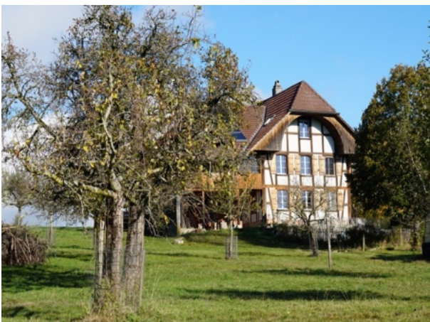
Hof Bützenmatt / Wohlen b. Bern