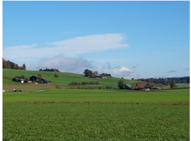
Kleinsiedlung Rain und Moosguet / Meikirch