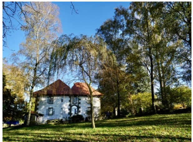
Schlössli Heimenhaus im Campagna-Stil / Kirchlindach