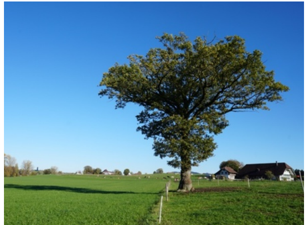
Weite Landschaft und markante Feldbäume / Kirchlindach