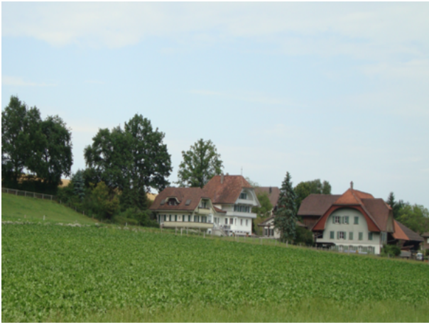
Weiler Niederlindach / Kirchlindach