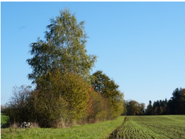
Hecken in Wohlen b. Bern