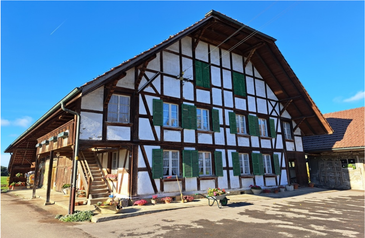
Abbildung 2: Barocke Haustypen charakterisieren die Weiler (Beispiel Möriswil)

vorgelagerten Gartenanlagen teils mit Springbrunnen. Die Weiler und Hofzugänge sind oft baumbegleitet. Dazu gesellen sich Landsitze von Patriziern, eigentliche Campagne, die an das Idealbild der venezianisch/römischen Landidylle erinnern.