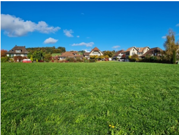
Weiler Unterwohlen / Wohlen