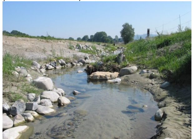
Revitalisierter Chräbsbach / Kirchlindach