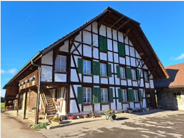
Weiler Möriswil / Wohlen b. Bern