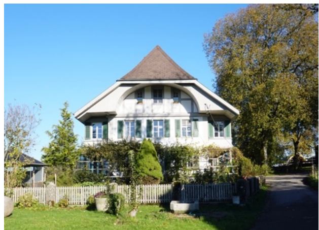
Weiler Niederlindach / Kirchlindach