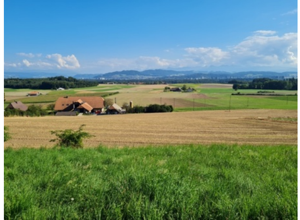
Ausblick von Uettligen / Wohlen