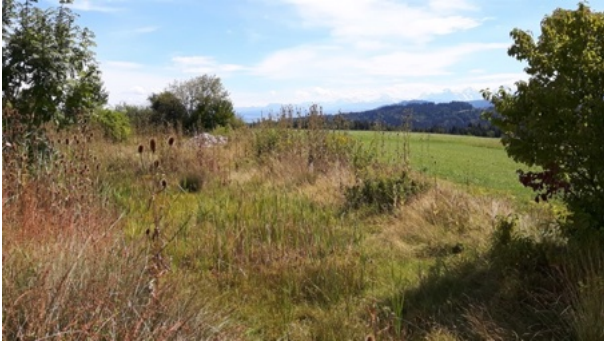
Weites Plateau Illiswil / Wohlen