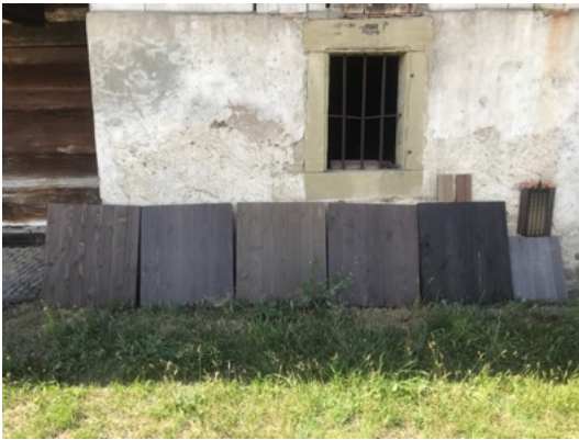
Abb. 5 Bemusterung vor Ort von verschiedenen Fassadenlasuren