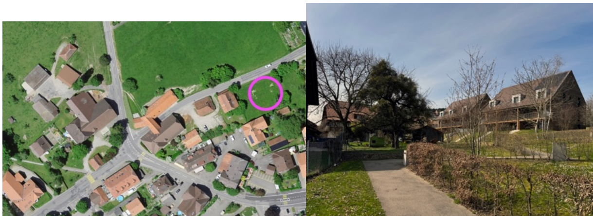
Abb. 4: Der Ort: Unmittelbar angrenzend an den gewachsenen Dorfkern von Meikirch (links), Das gebaute Resultat. Grosse Satteldächer, Holz, verschiedene Brauntöne: integratives Bauen (rechts)

Unmittelbar anschliessend an das Dorfzentrum von Meikirch wurden zwei Mehrfamilienhäuser geplant. Die Bauberatung begleitete den Prozess in mehreren Begehungen vor Ort bezüglich Volumetrie, Fassadierung, Materialisierung und Aussenraumgestaltung mit dem Ziel, dass sich die Neubauten möglichst gut in diesen sensiblen Ort integrieren.