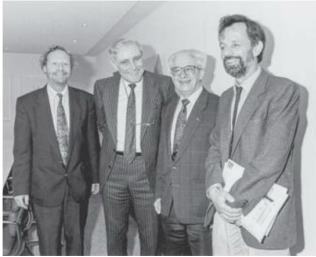
Willy Loretan (2.v.r.) 1990 mit Hans Weiss, Geschäftsleiter der SL-FP, Bundesrat Flavio Cotti und Bernard Lieberherr (bei der SL-FP zuständig für die Westschweiz) (v.r.n.l.)

Stiftung Landschaftsschutz Schweiz Fondation suisse pour la protection et l'aménagement du paysage Fondazione svizzera per la tutela del paesaggio Fundaziun svizra per la protecziun da la cuntrada