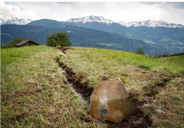
Bild 09) Traditionelle Bewässerung Ausserberg