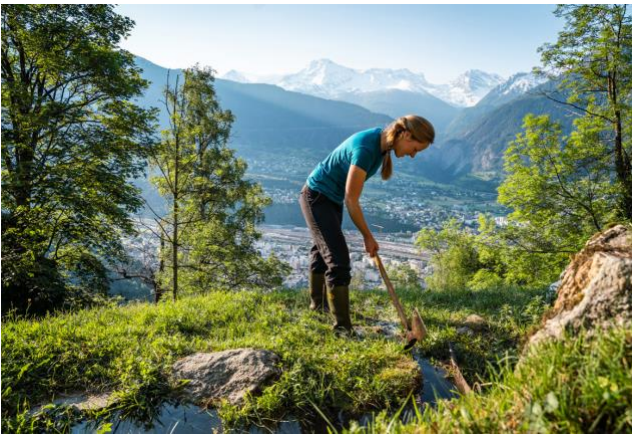
Bild 13) Traditionelle Bewässerung in Naters