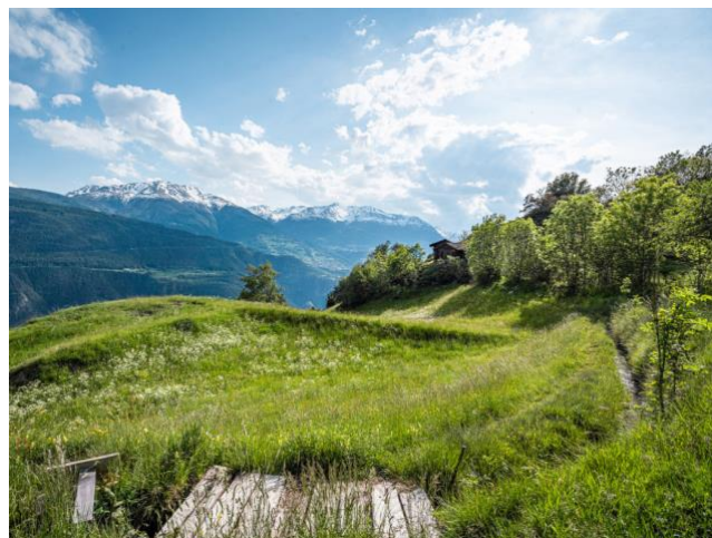
Bild 08) Kulturlandschaft am Niwärch in Ausserberg