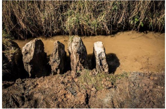
Bild 12) Traditionelle Bautechnik (Bau eines Tretschbords)