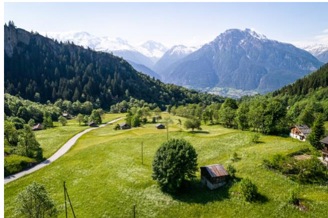
Bild 14) Hangbewässerungslandschaft am Natischerberg