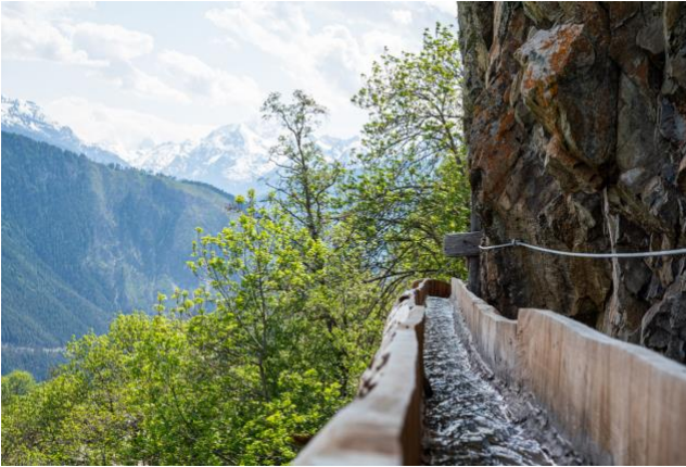
Bild 05) Das Steiwasser in Mund