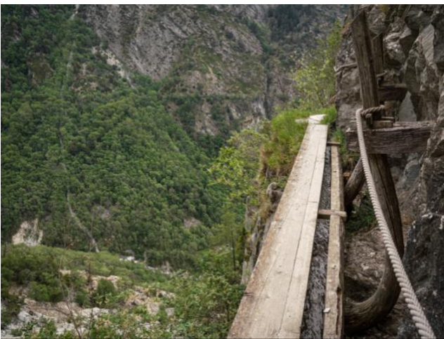
Bild 07) Suone im Baltschiedertal