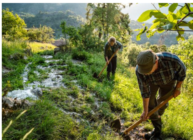
Bild 04) Feinverteilung des Wassers auf den Wiesen